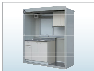
キッチンカブセル