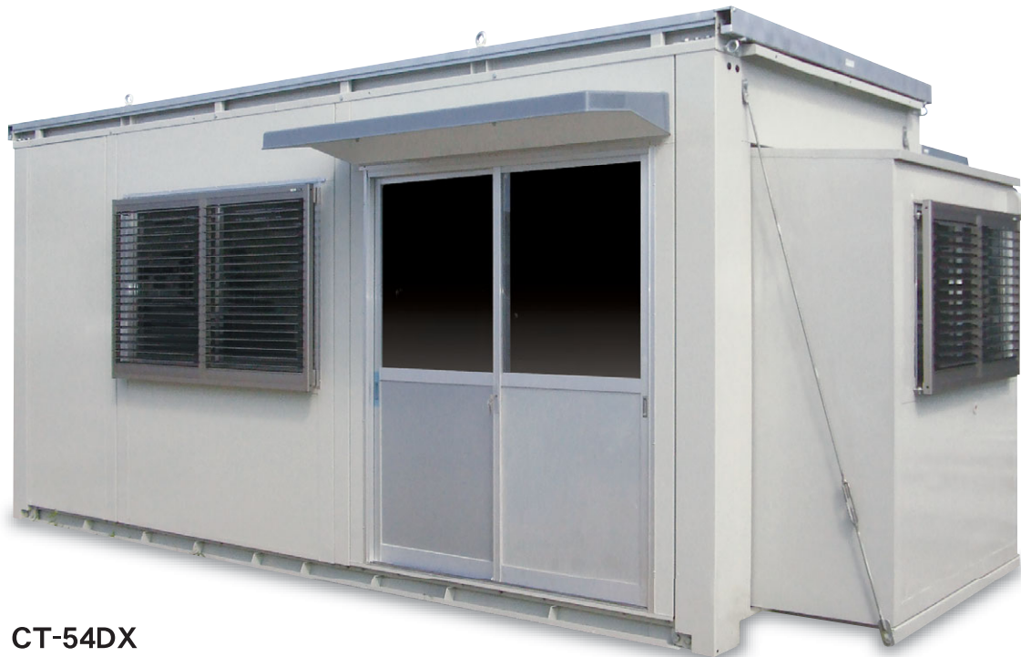
CT-54DX L5570×W2406×H2650 12.99㎡ (3.93坪)