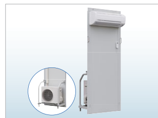
エアコン付きパネル