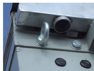
耐風養生用ワイヤーロープ固定金具